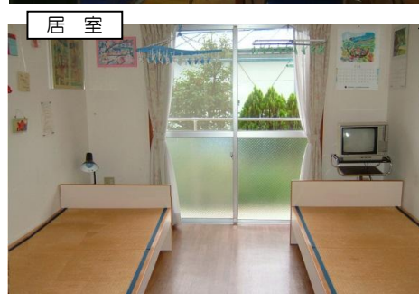
全室南向き、フローリング&ローベッドです。