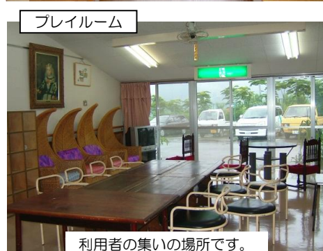
利用者の集いの場所です。