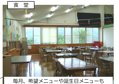
毎月、希望メニューや誕生日メニューも

開所年月日 平成 5年 5月 1日 構造 鉄骨造 2階建 床面積 2036.94㎡ 敷地面積 6606.93㎡ 定員 生活介護50名 施設入所支援35名 短期入所5名