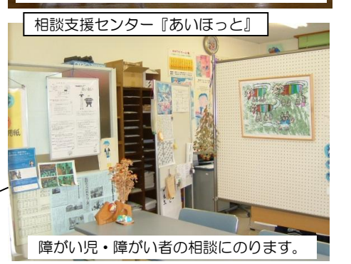
障がい児・障がい者の相談にのります。